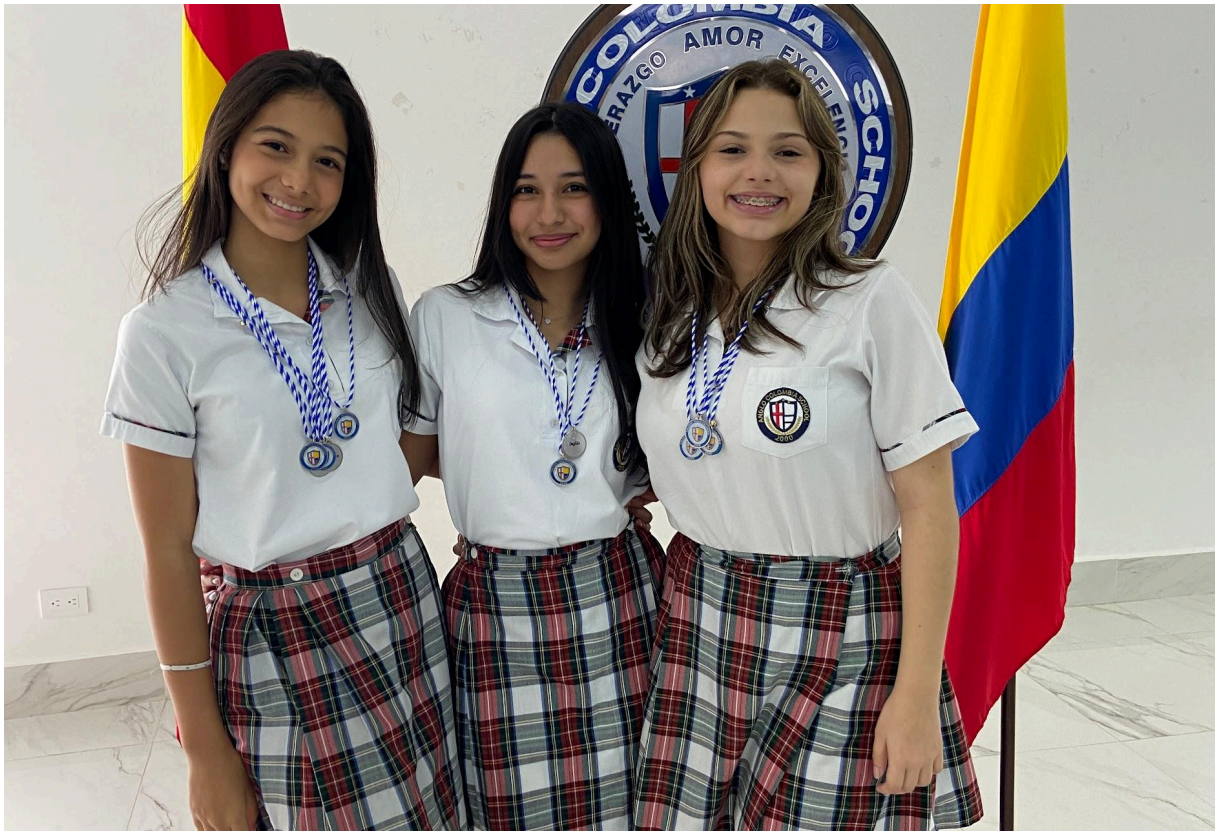
Ilustración 1: Estudiantes del Anglo Colombia School recibiendo un reconocimiento por sus logros académicos.

“Cuando el objetivo te parezca difícil, no cambies de objetivo; busca un nuevo camino para llegar a él “. Autor: Confucio.