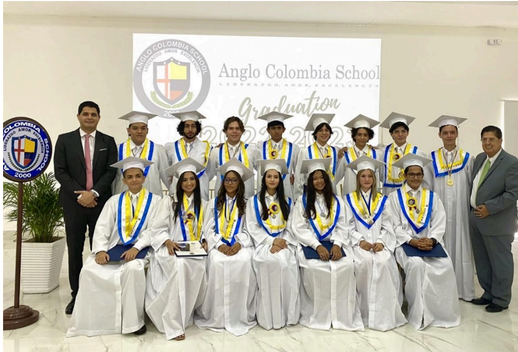
Ilustración 2: Promoción de Grado 11, 2023 – 2024