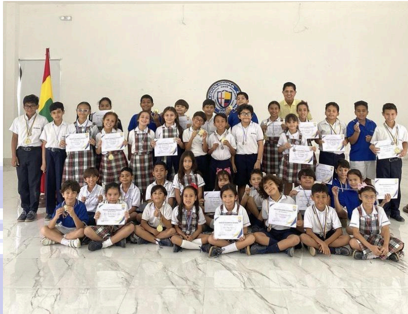
Ilustración 7: Estudiantes valorados por su esfuerzo académico.

“Educa a los niños y no será necesario castigar a los hombres.” Pitágoras.