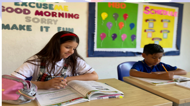
Ilustración 8:Salón de clases ACS

“Donde hay educación no hay distinción de clases”. CONFUCIO.